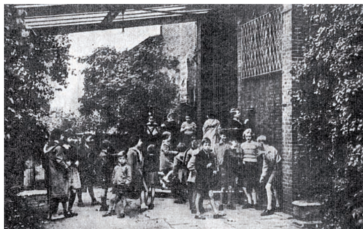
1957: Begeisterung, Aufregung und Verwirrung am ersten Schultag im „Timberlake House“ im Harvestehuder Weg.