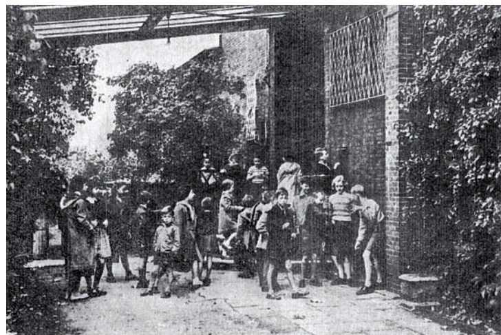
1957: Joy, excitement and confusion on the first school day at the 'Timberlake House', Harvestehuder Weg.